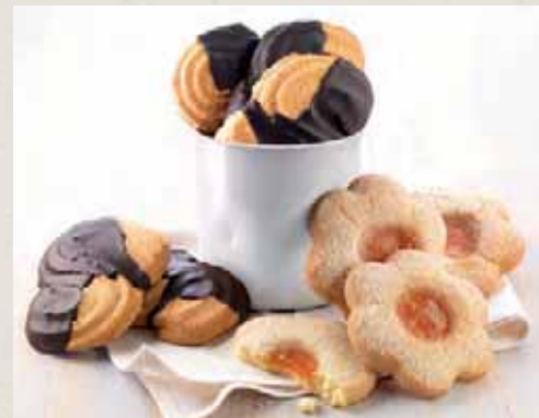
Linea frolle e biscotti pag. 66