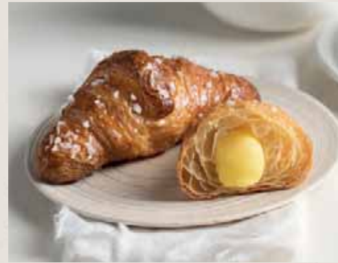
Linea hôtellerie pag. 54