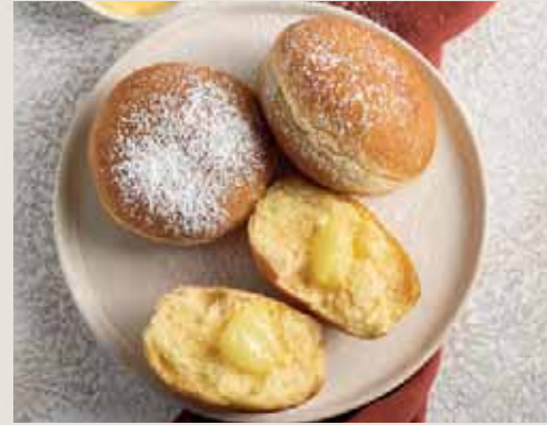
Linea già cotti pag. 40