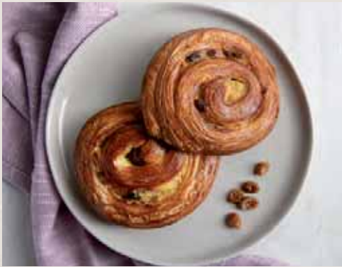
Linea burro pag. 33