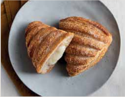
Linea sfoglie pag. 26