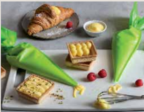
Linea creme pag. 38